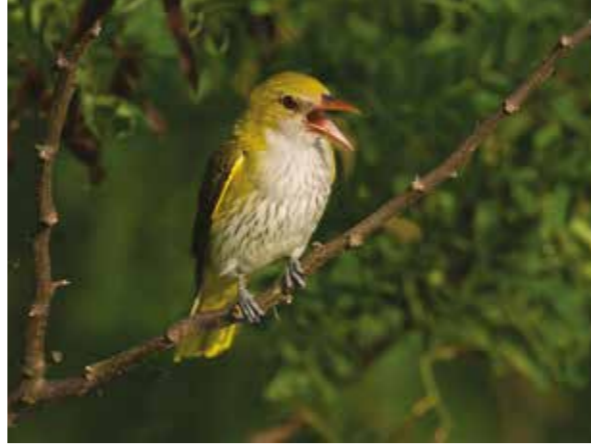
Sommargylling ( Oriolus oriolus )

Vinterfodret till djuren på Ottenby bärgades under lång tid från ett mycket stort änggärde, Skogsgär-