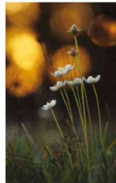
T.h. Slätterblomma ( Parnassia palustris )

De fåglar som sätter sin prägel på området är, i de buskrika markerna, framför allt arter som t ex hämpling, törnskata, törnsångare och ärtsångare. Till de mer ovanliga hör rosenfink och höksångare. Längre söderut längs med fyrvägen där Västra mark övergår till strandäng ses bla rosakar, strandskata, tofsvipa, smätärna och silvertärna.