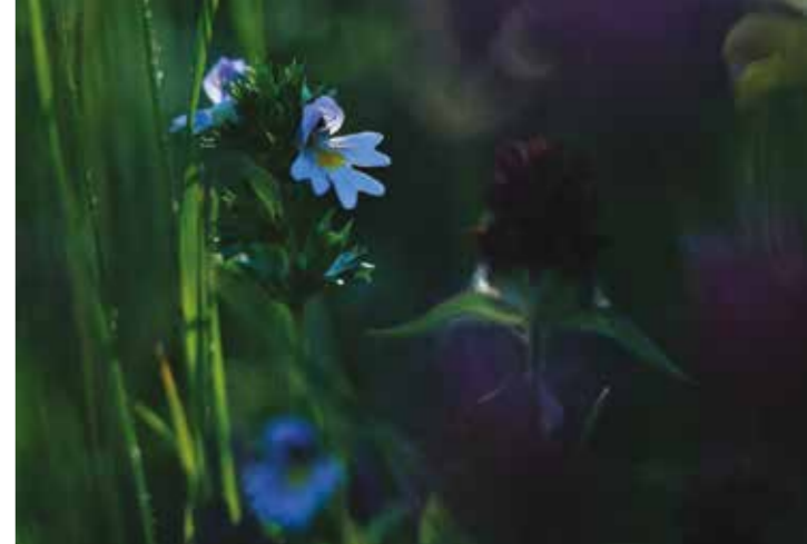
Späd ögontröst ( Euphrasia stricta var. tenuis )

Namnet Schäferiängarna är först känt från Linne’s öländska resa 1741, på tidigare kartor heter denna del av änggärdet Skogsgårdsängen.