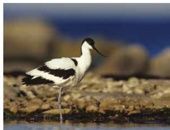
Skärfläcka ( Recurvirostra avosetta )