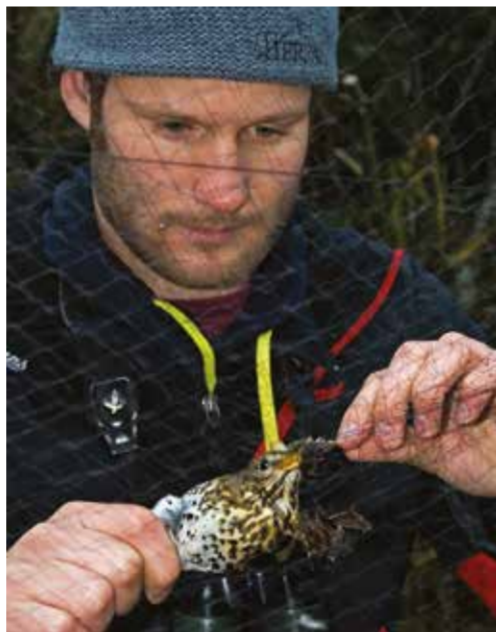
En taltrast plockas med van hand ut ur ett nät vid Ottenby fågelstation.