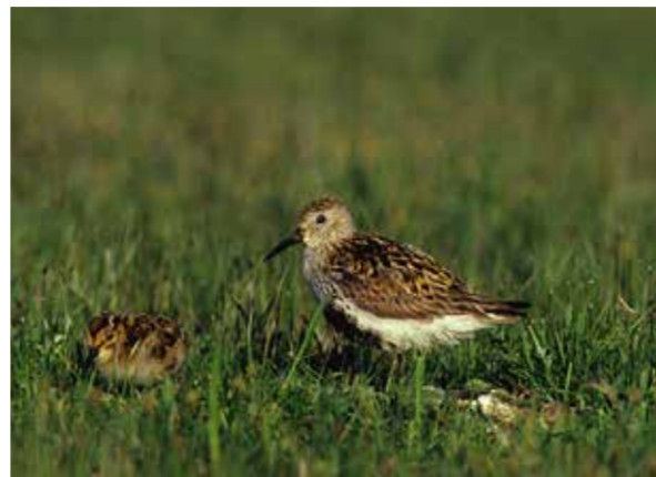
Sydlig kärnsnäppa ( Calidris alpina ssp. schinzii )